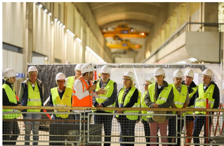
EDF, usine maremotrice de la Rance