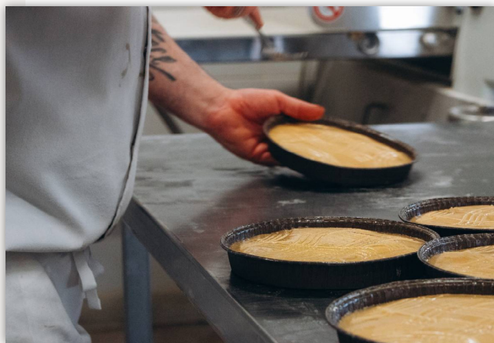
Biscuiterie du Pays de Douarnenez

Les petites et moyennes entreprises veulent maîtriser l'ensemble de la chaîne de valeur et optimiser leurs marges. Le panier moyen post visite augmente significativement : l'Atelier du Verre (+80%), la conserverie Kerbriant (+30%), la Distillerie des Menhirs (+25%).