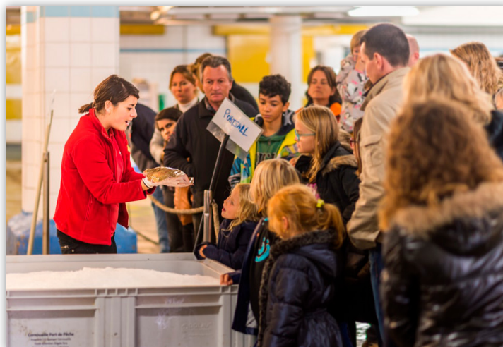
Haliotika, Cité de la pêche

C'est encore faible et c'est un chantier désormais prioritaire d'Entreprise et Découverte : faire de la Visite d'entreprise un outil privilégié et qualifié de découverte des métiers, de recrutement et d'inclusion.