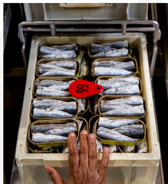
Conserverie La Belle-Iloise