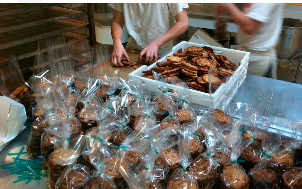
Biscuiterie du Pays de Douarnenez