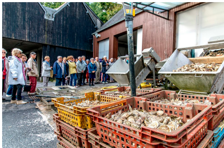
Ferme Marine

* Sur la base des données 2024 communiquées par les entreprises. Merci de citer Entreprise et Découverte pour toute exploitation de ces données.